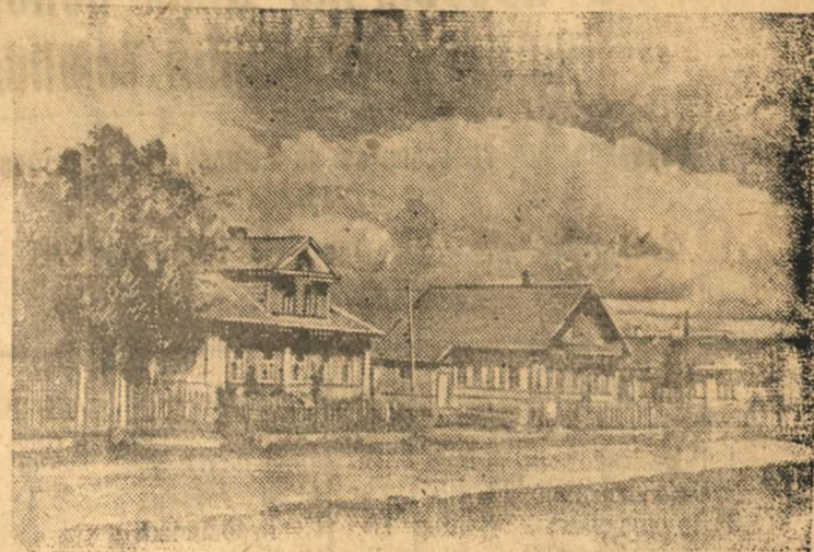
В колхозе «Объединенный труд», Пешехоно-Володарского района, Ярославской области, идет строительство колхозных домов.

Да здравствует вождь советского народа — Великий Сталин! (Бурные, долго несмолкающие аплодисменты, переходящие в овацию. Все встают. Возгласы: «Великому Сталину — ура!»)