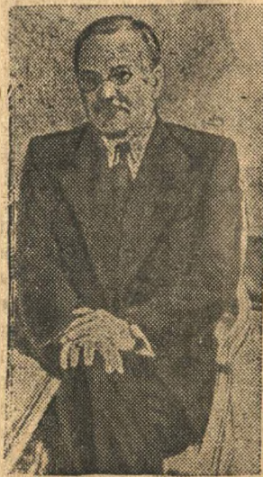
В. М. МОЛОТОВ.

Как сказал товарищ Сталин: «Наш советский народ не жалея сил и труда во имя победы Мы пережили тяжелые годы. Но теперь каждый из нас может сказать: мы победили. Отныне мы можем считать нашу отчизну избавленной от угрозы немецкого нашествия на Западе и японского нашествия на Востоке. Наступил долгожданный мир для народов всего мира».