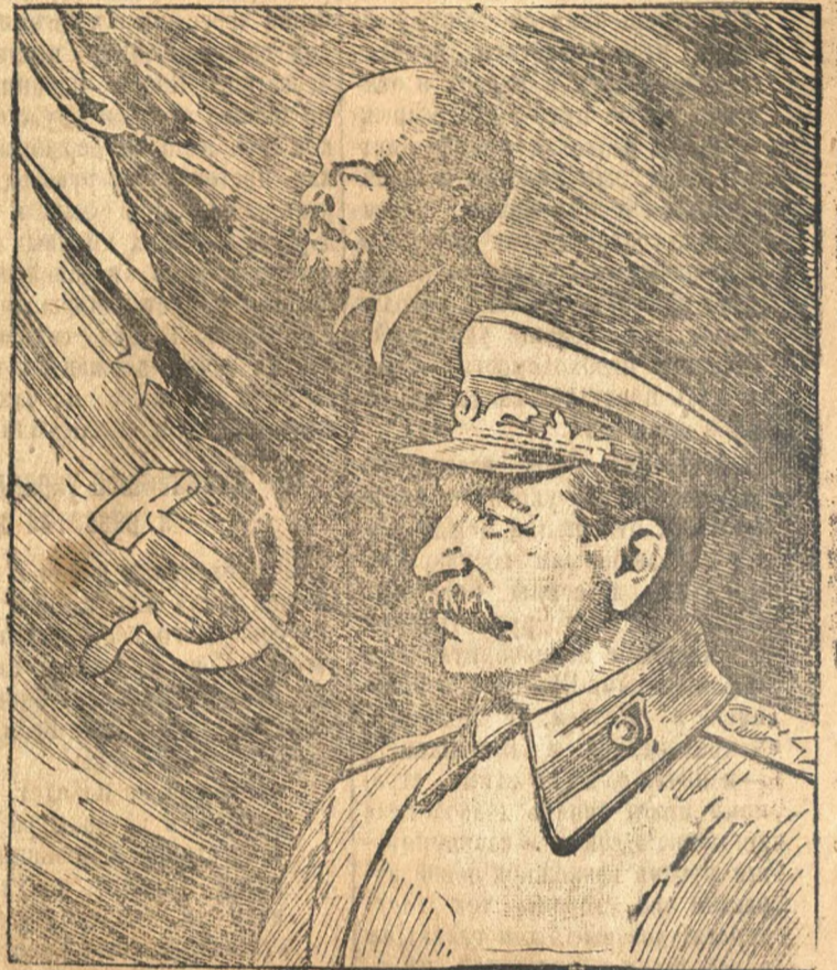
Под знаменем Ленина — Сталина, вперед к новым победам!

Мы должны решить, как можно скорее, неотложные задачи в отношении тех советских территорий, которые временно находились под оккупацией вражеских армий. Немцы оставили после себя много разоренных городов и тысячи разоренных и