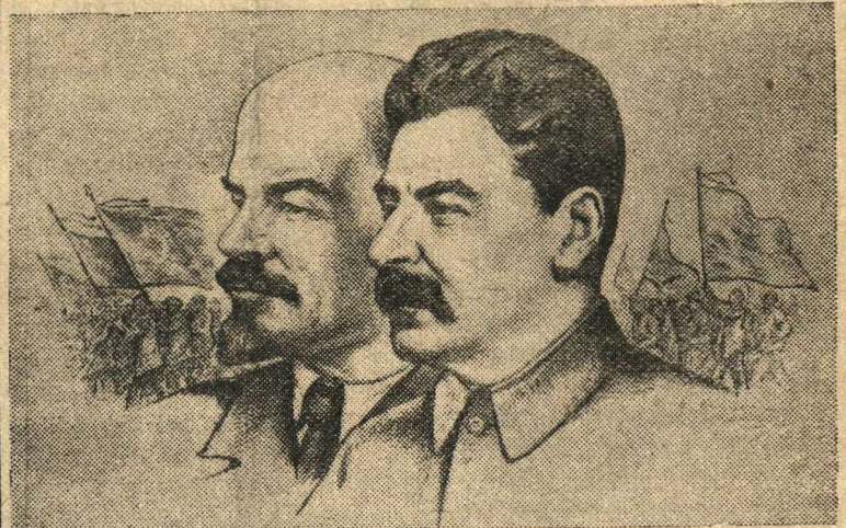
В. И. Ленин и И. В. Сталин.