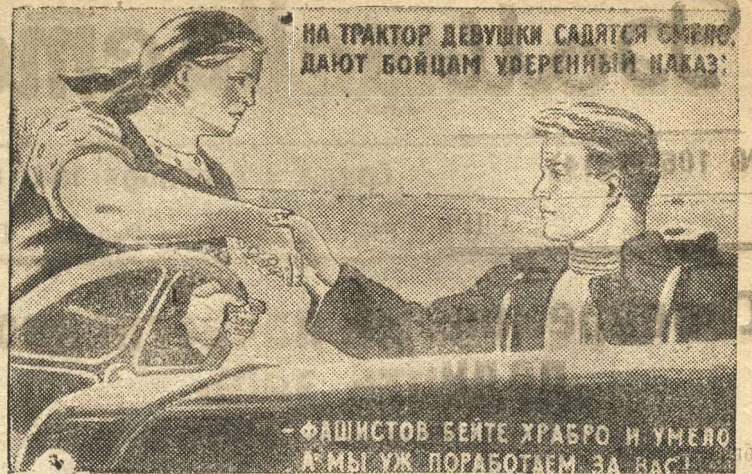
Рисунок Т. Ереминой.

(Репродукция с плаката, выпускаемого издательством «Искусство», Фотохроника ТАСС.)