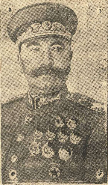
Маршал Советского Союза Семен Михайлович БУДЕННЫЙ.