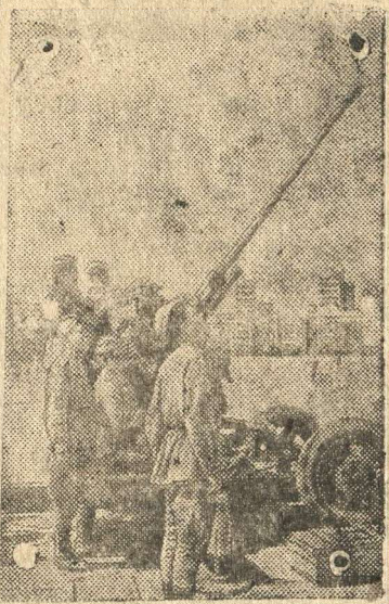
На снимке: зенитчики на площади Дзержинского.