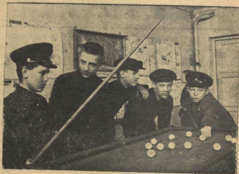
Днем они самоотверженно работают на своих постах, вечером они культурно проводят свой отдых. На снимке: группа учеников ремесленного училища за игрой на бильярде.