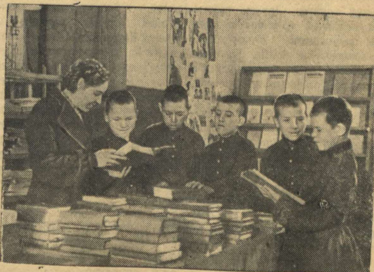
На снимке: ученики ремесленного училища № 21 в библиотеке завкома выбирают интересные книги.