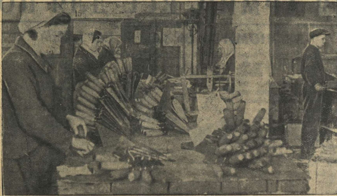
На снимке: работницы инструментального цеха № 4 во время сортировки инструмента.