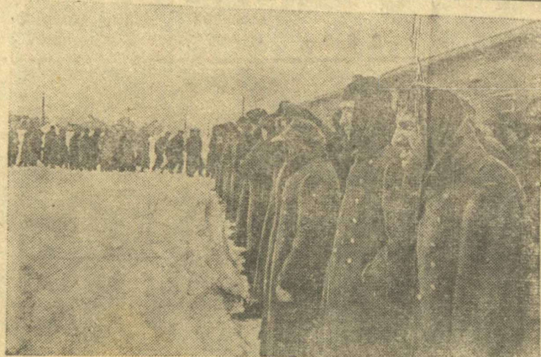
Первый Белорусский фронт.

Во всех цеховых партийных организациях начата подготовка к проведению теоретической конференции по IX главе «Краткого курса истории ВКП(б)» (раздел второй) — о профсоюзной дискуссии.