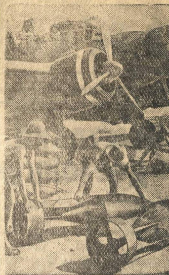
Погрузка бомб в самолет на аэродроме в одной из итальянских колоний.