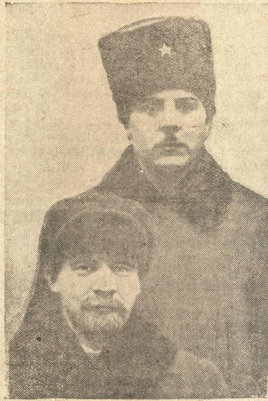
В. И. Ленин и К. Е. Ворошилов (1921 г.)

от обязанностей секретаря райкома партии по кадрам и отвел его из состава членов бюро и членов пленума РК ВКП(б) и избрал секретарем РК ВКП(б) по кадрам тов. Челнокова И. Е., освободив его от обязанностей заведующего военным отделом райкома ВКП(б).