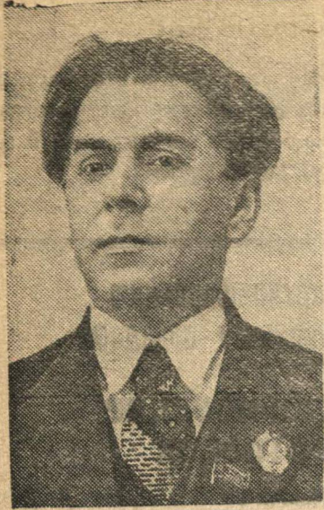
Украинский поэт-орденоносец депутат Верховного Совета СССР Павло Тычина.