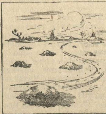
Как не надо складывать навоз в поле.

сывание навоза мелкими кучками по всему полю. В зимний период такой навоз сильно промерзает, а с наступлением весны полностью высыхает. Одна часть питательных веществ улетучивается, другая весенними водами выщелачивается и уносится в реки или попадает в почву непосредственно под кучкой навоза. Все это обесценивает навоз и создает большую пестроту в росте и созревании хлебов.