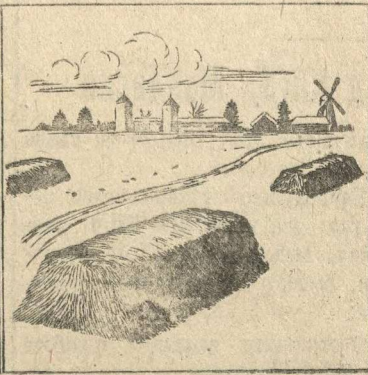
Как правильно складывать навоз.