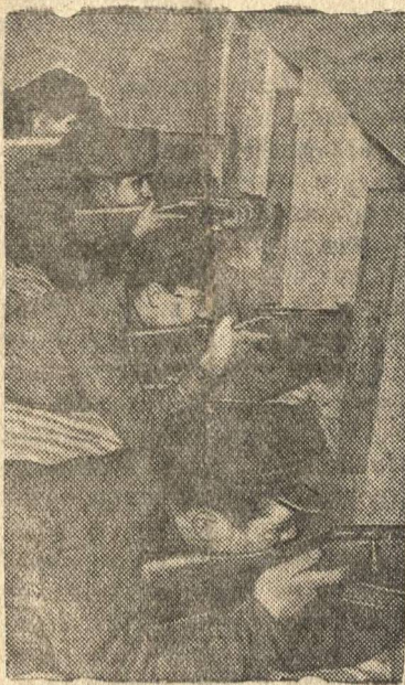
Студенты-комсомольцы Московского электромеханического института инженеров железнодорожного транспорта имени Дзержинского на линии огня.

Заочные стрелковые соревнования между комсомольцами Москвы и Ленинграда.