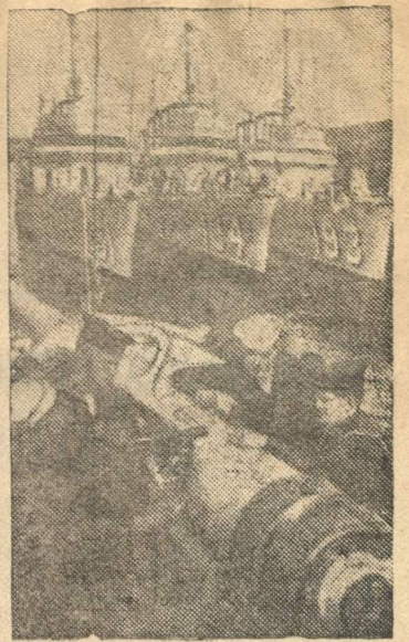
Американские эсминцы, переданные Англии, в одном из английских портов.