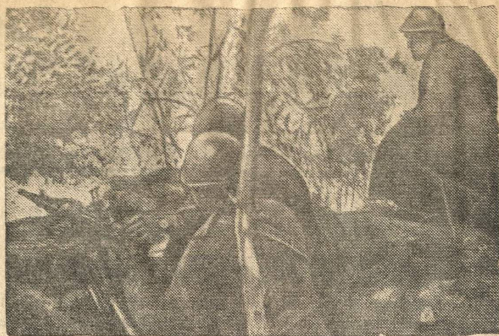
Итальянская огневая пулеметная позиция на греко-албанском фронте.