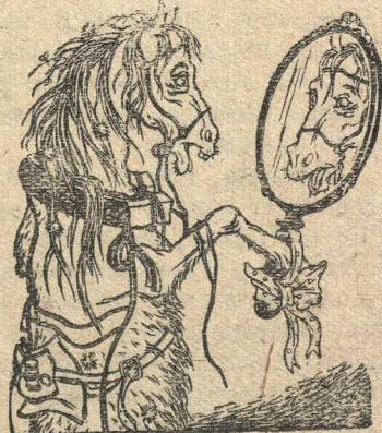
—Что-то я неважно выгляжу, не обратится ли мне за советом к прокурору?