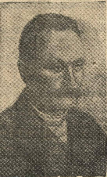
И. Я. Франко.

28 мая исполнилось 25 лет со дня смерти выдающегося украинского писателя и ученого И. Я. Франко.