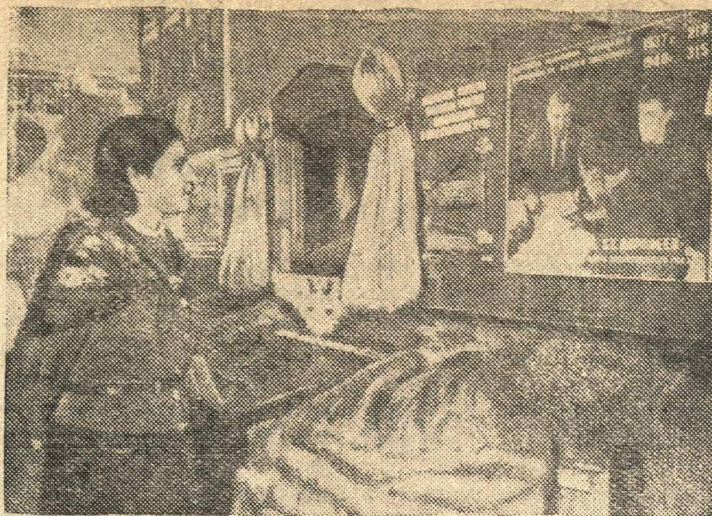
Стенд колхоза «1 мая», Краснохолмского района, Калининской области в павильоне «Лен, конопля, и новые лубяные культуры». Колхоз получил урожай льна в 1940 году по 7 центнеров с гектара на площади 44 га.