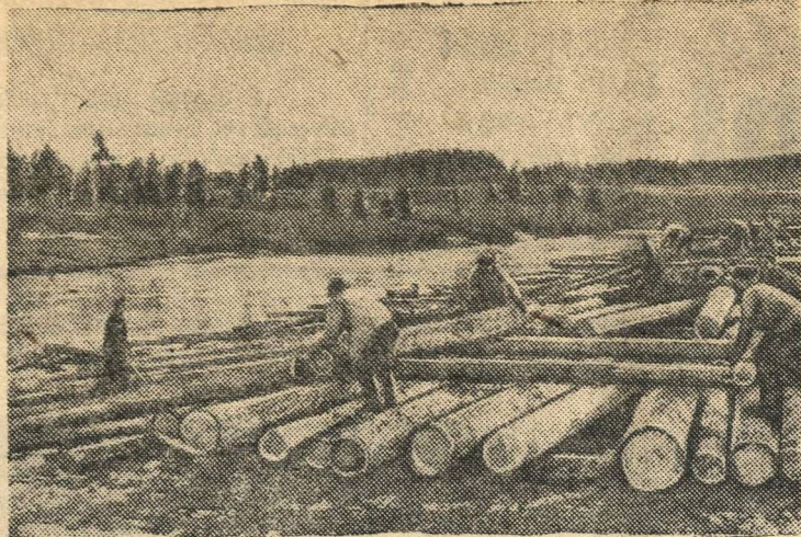
Отгрузка древесины на Билимбаевском сплавном участке.

Сплава леса по реке Чусовой (Свердловская область)