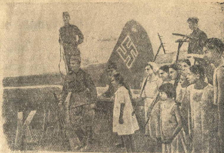
Фашистский самолет, сбитый отважными советскими летчиками.

Год издания 7-й Четверг 7 августа 1941 года. № 172 (1508) Цена отд. № 5 к. Вых. ежедневно