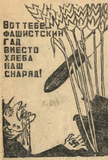
Плакат работы художника М. Китизарьяна, ТАСС.

Вновь секретарем районного комитета комсомола избран тов. Пакин.