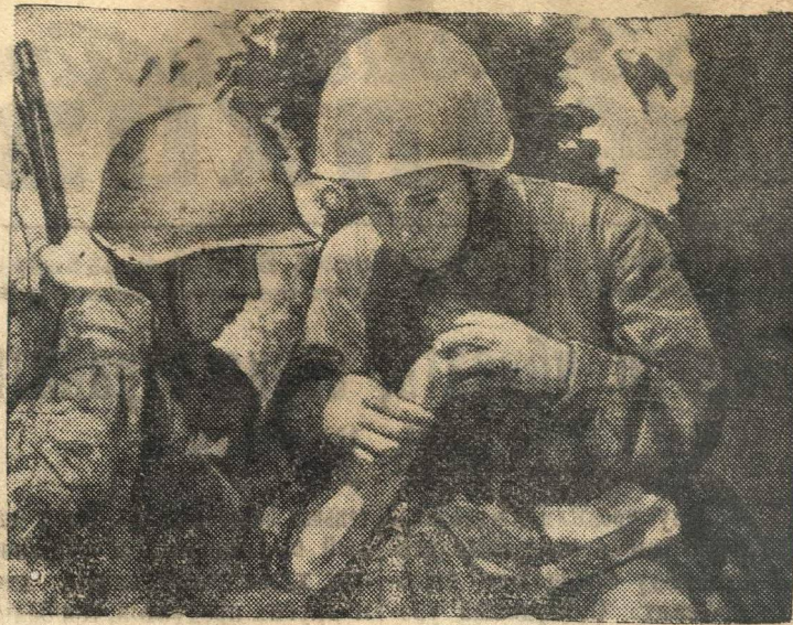
Оказание первой помощи раненому бойцу.