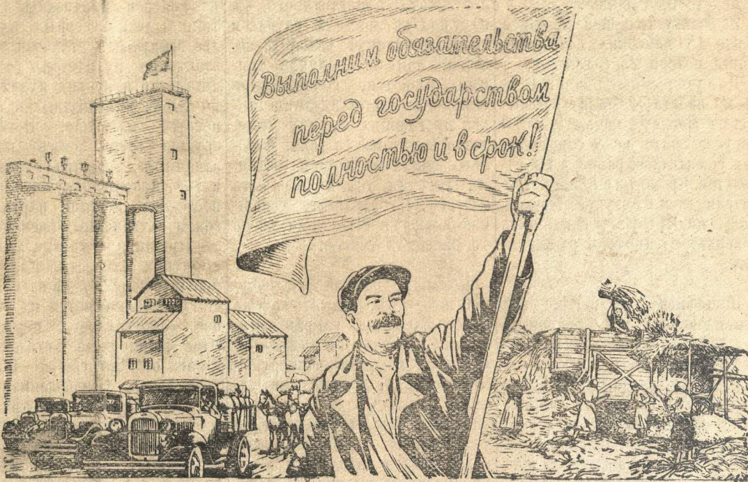
Рисунок В. Баркова и В. Лисевича