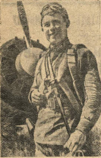
Н. Я. Тотмин.

Действующая Армия. В воздушном бою с противником комсомолец-старшина Н. Я. Тотмин протаранил вражеский истребитель, а сам благополучно вернулся на свой аэродром.