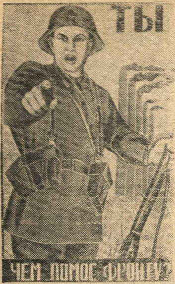
Рисунок художника Моор.