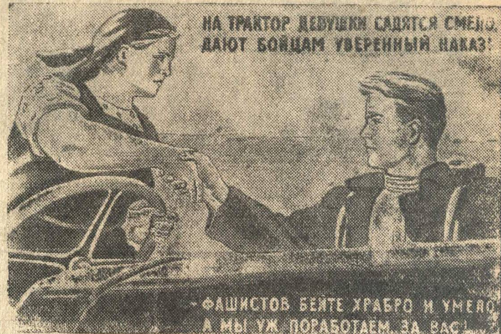
Рисунок Т. Еремшиной.

(Репродукция с плаката, выпускаемого издательством «Искусство».)