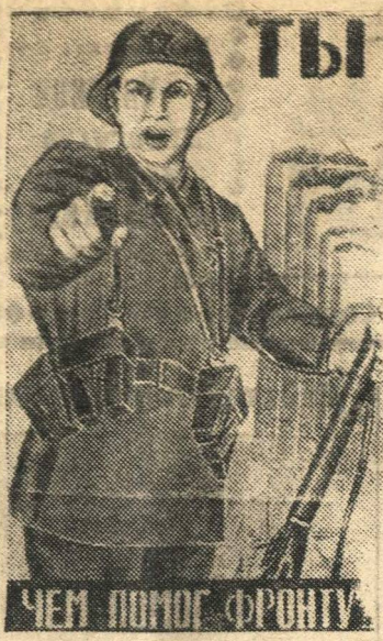
Рисунок художника Моор

Каждый день, каждый час Самоотверженным трудом Будем ковать победу над врагом!