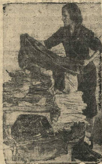
Сотрудница швейной мастерской Сафонова принимает подарки бойцам на фронт. (Москва, Дзержинский район).