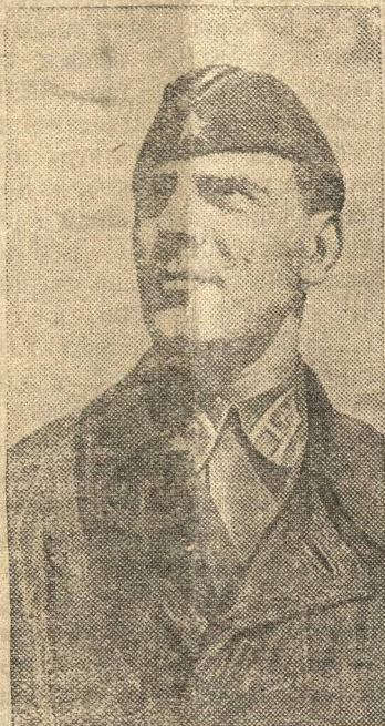
Капитан В. И. Матвеев. За образцовое выполнение боевых заданий Командования на фронте борьбы с германским фашизмом и проявленные при этом отвагу и героизм ему присвоено звание Героя Советского Союза.