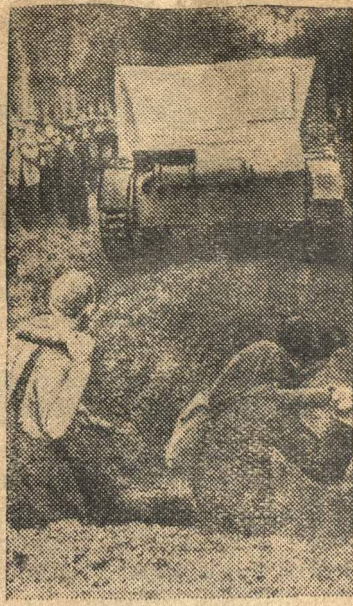
Ленинградцы встают на защиту своего города.

Немецко-фашистские войска угрожают городу Ленина. Они хотят захватить его. Но коварные планы врага не осуществляются. Трудящиеся Ленинграда — все, как один, встают на защиту своего города, своих очагов, своих семей, своей чести и свободы. Любый и ненавидимый враг будет наголову разбит. Ленинградские рабочие, служащие и интеллигенция в свободные от работы часы упорно изучают военное дело, осваивают способы вооруженной борьбы, чтобы быть готовыми стать в боевые ряды сражающихся с бандами фашистских людоедов.