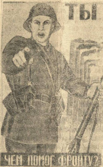
Рисунок художника Моор