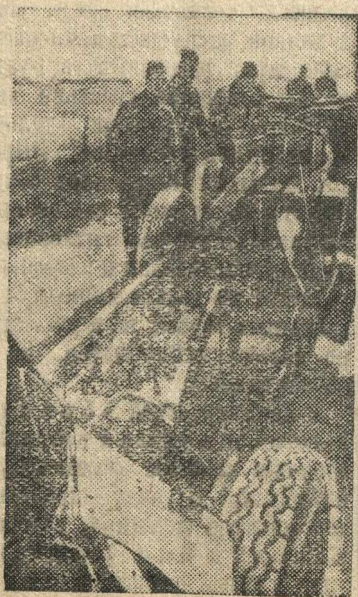
Немецкие орудия, отбитые в боях у фашистов славными войсками Н-ской дивизии.