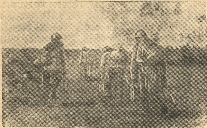
Пулеметчики направляются на линию огня. (Западное направление).