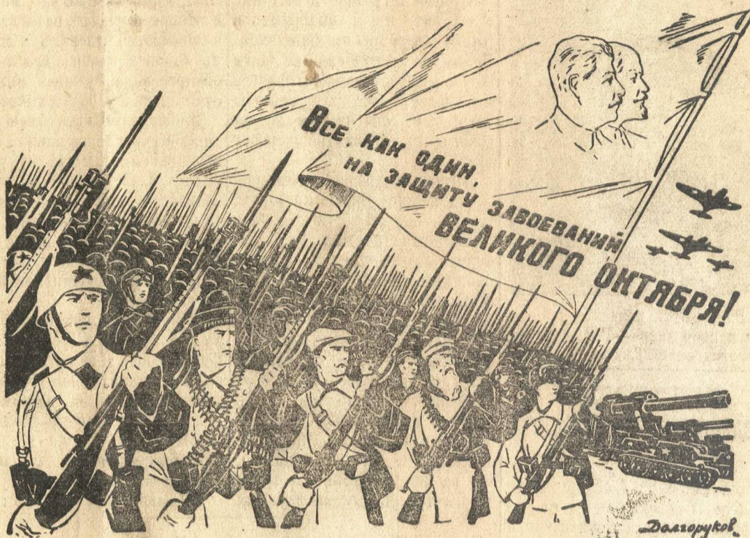
Рисунок художника Долгорукова

Да здравствует Всесоюзная Коммунистическая партия большевиков, партия Ленина — Сталина, — организатор борьбы за победу над немецко-фашистскими захватчиками!