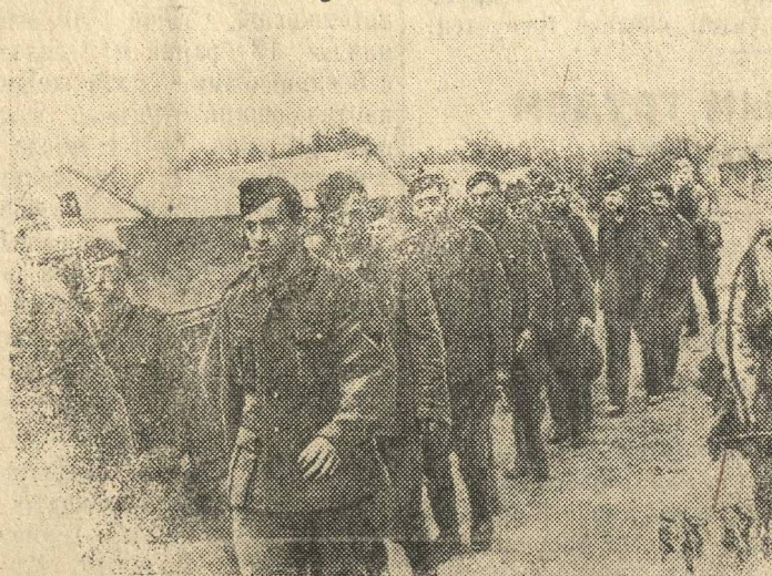
Бойцы ведут группу пленных фашистов, захваченных в одном из боев под местечком Н. (Западное направление).