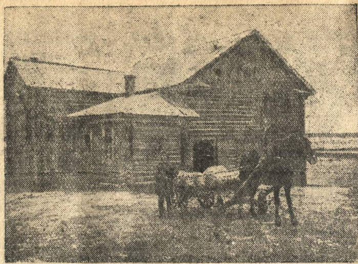
На снимке: колхозная турбинная мельница сельхозартели имени Сталина, Лапшангского сельского Совета.