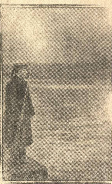
В героическом Севастополе

Противник, не считаясь с огромными потерями, продолжает ожесточенный штурм Севастополя. Главные защитники города ведут самоотверженную борьбу с превосходящими силами гитлеровцев. В течение дня немцы произвели до 20 атак на позиции, которые обороняет подразделение части, где командиром тов. Гузаров. На поле боя остались сотни трупов солдат и офицеров противника. Бойцы роты под-