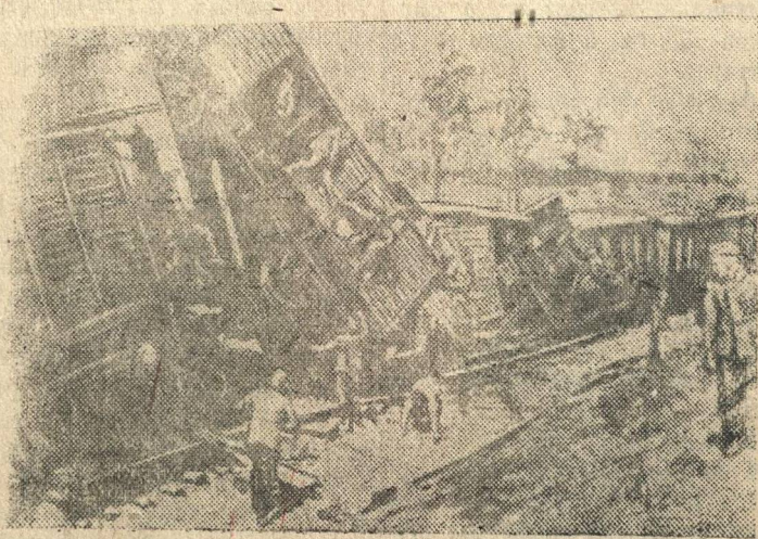
На снимке: крушение немецкого воинского эшелона, организованное одним из отрядов партизан. (Снимок найден у убитого немецкого офицера).

Получено сообщение о гнусном преступлении немецко-фашистских мерзавцев в деревне Семеновка, Орловской области. 7 девушек из этой деревни были насильно увезены в соседний город для отправки их в Германию. По дороге девушки сбегали и вернулись в свою деревню. Несколько дней спустя гитлеровские людоеды согнали на площадь всех жителей Семеновки и расстреляли бежавших девушек.