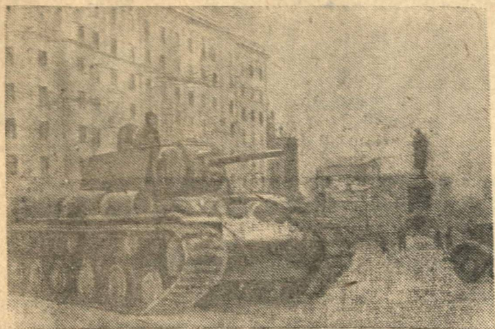
Москва в дни немецко-фашистского наступления. На снимке: Тяжелые танки проходят по площади Пушкина, направляясь на фронт.

К годовщине разгрома немцев под Москвой. Год назад Красная Армия в ожесточенных боях под Москвой разбила немецко-фашистские войска и отбросила их от столицы.