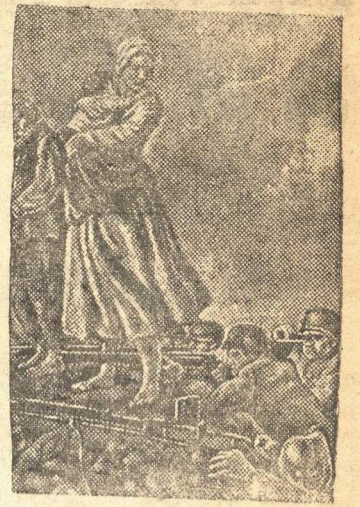
На снимке «Барварство немецких оккупантов» — картина работы художника И. Тойдзе.

Выставка «Великая Отечественная война» в Государственной Третьяковской галерее.