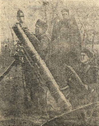
Товарищи! Врага громите. Трудом героическим и рублем. — Подпиской, бейте на Заем — Как мы на минометов бьем!