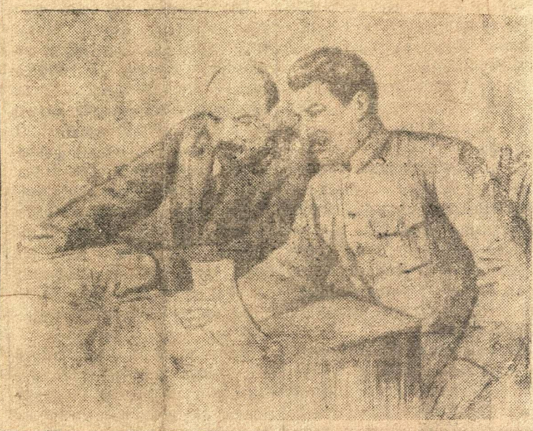
Рисунок худ. П. Тасильева