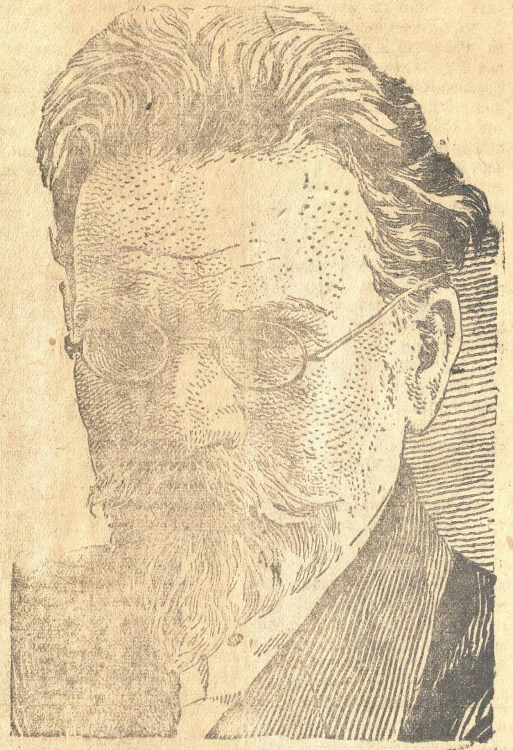
ПРЕДСЕДАТЕЛЬ ПРЕЗИДИУМА ВЕРХОВНОГО СОВЕТА СССР ГЕРОЙ СОЦИАЛИСТИЧЕСКОГО ТРУДА М. И. КАЛИНИН