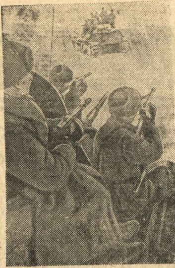
Действующая Армия (Центральный фронт). На снимке: Танковый десант направляется в тыл противника.