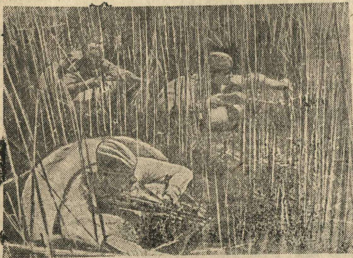
Действующая армия. (В плавнях Кубани). На снимке: Разведчики орденосеца Гандрохимов, Гацаев и Лунев отправляются в специальном снаряжении на боевое задание.