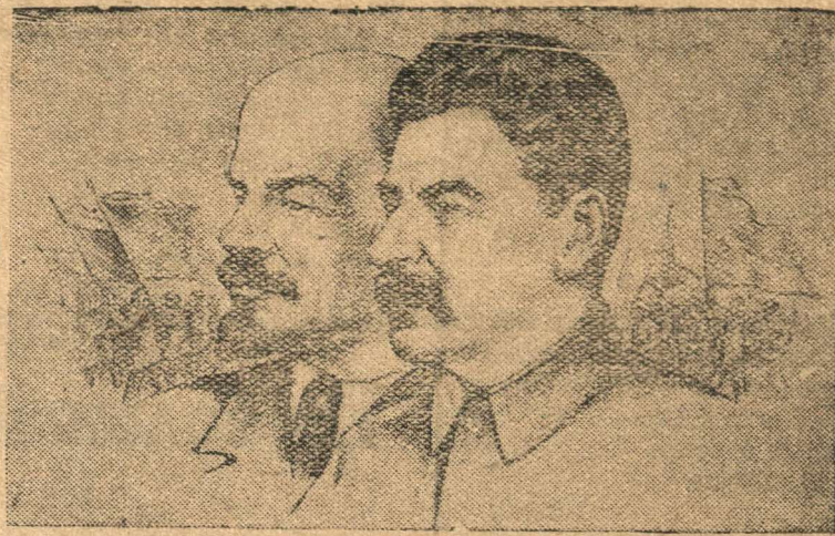
В. И. ЛЕНИН и И. В. СТАЛИН.

(С рисунка — работы художника В. П. Васильева)