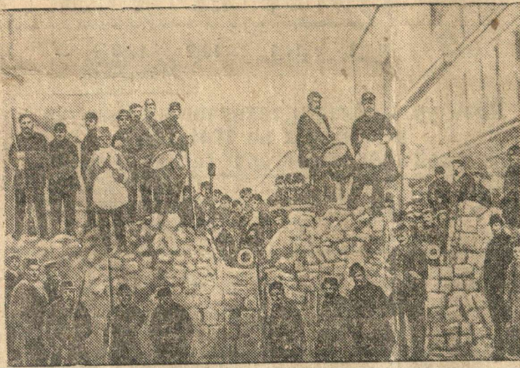
Баррикады на улице Басфруа и ул. Шаррон в Париже 18 марта 1871 г.

Развернутое и в то же время чрезвычайно сжатое определение исторического значения Коммуны