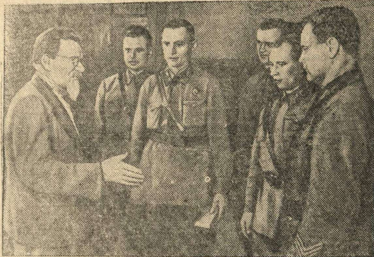
Товарищ М. Н. Калинин беседует в Кремле с героями летчиками, награжденными орденами и медалями СССР за образцовое выполнение боевых заданий Командования на фронте борьбы с германским фашизмом и проявленные при этом доблесть и мужество.