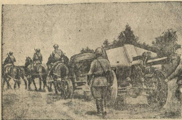
Советские артиллеристы продвигаются на передовые позиции.