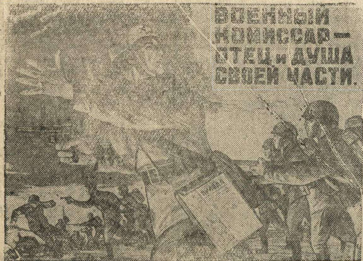
Рисунок художника Малгцева.

(Репродукция с плаката, выпускаемого издательством «Искусство»).