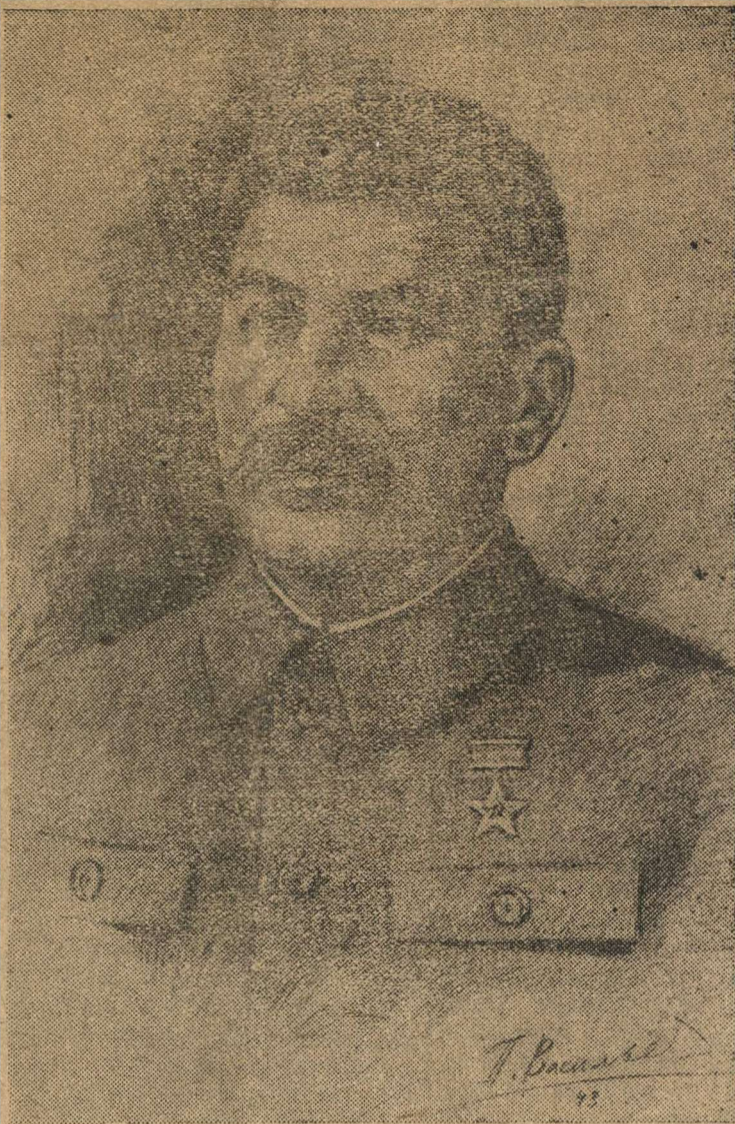
И. В. Сталин.