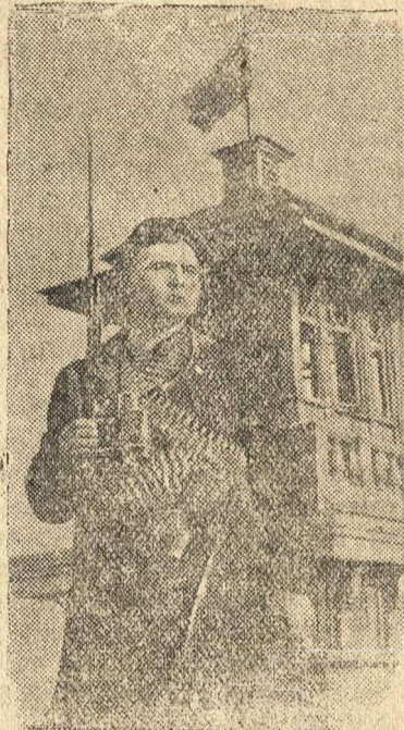
Краснофлотский пост воздушного наблюдения на крыше одного из домов.