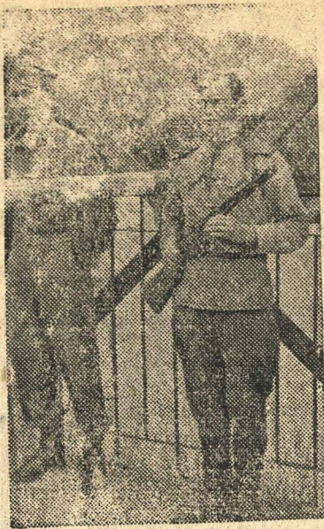
Австрия. На демаркационной линии между советской и американской зонами на реке Эн; в Австрии.

Такова роль списков избирателей в системе выборов. Поэтому вся работа по их составлению и проверке имеет такое важное политическое значение в нашей длинно демократической стране.