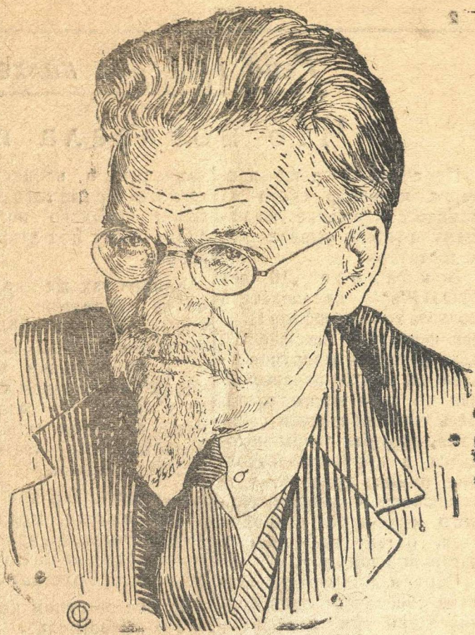
Председатель Президиума Верховного Совета СССР М. И. КАЛИНИН.